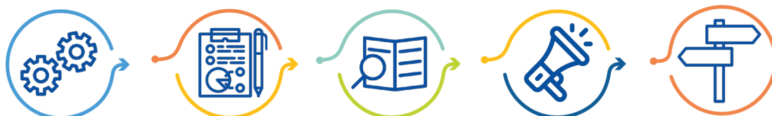
Programmplanung Auswahl Überwachung Kommunikation und Sichtbarkeit