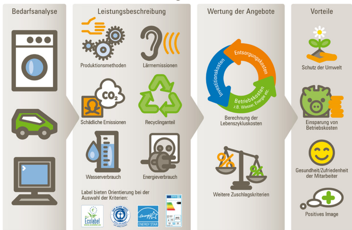
Abbildung 1: Schematischer Überblick über Umweltaspekte im Vergabeverfahren, Berliner NetzwerkE ( www.berliner-netzwerk-e.de )