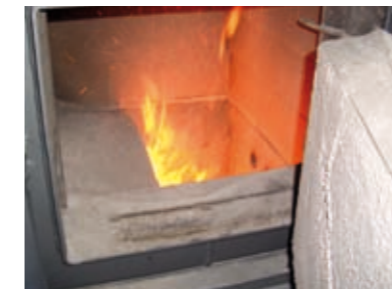
Wärme aus der Natur

Steigende Energiepreise haben Hausbesitzer im letzten Jahr zusätzlich belastet. 10 Haushalte aus Byhleguhre im Spreewald wollten dem etwas entgegensetzen und beschlossen ein Nahwärmenetz mit umweltfreundlicher Energie aufzubauen.